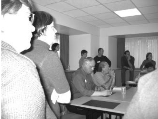
We luisteren kritisch naar mekaars werk

Tot slot kozen we dertien referentiepersonen uit een lijst van deskundigen en vertegenwoordigers die zich bereid hadden verklaard om tijdens het laatste weekend op onze vragen te antwoorden. We hielden hierbij rekening met hun specifieke kennis en achtergrond.