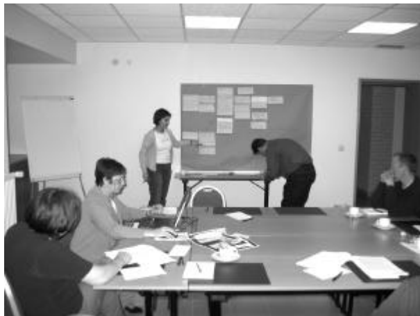
De thema's worden uitgewerkt

De rest van de dag omschreven we in parallele sessies en thema per thema de relatie met genetisch gewijzigd voedsel en hun belang voor ons. Op basis hiervan formuleerden we