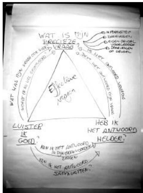
Vragen stellen: tips & tricks