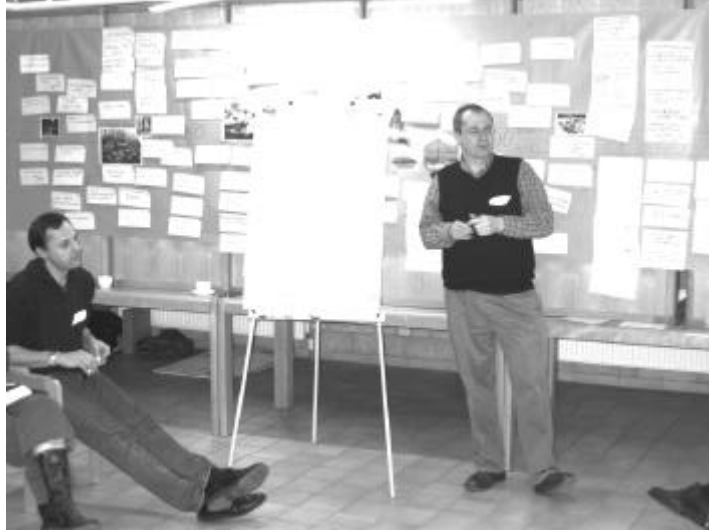
Voeding en eten: vroeger, nu en in de toekomst

er achter al deze verhalen, herinneringen en verwachtingen lag: “welke waarden en normen hebben we met betrekking tot eten en voeding?”