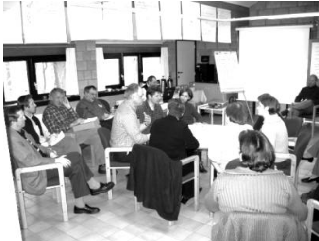
Moet het onderzoek naar genetisch gewijzigd voedsel stopgezet worden? "De zevende dag", live in De Bremberg

De groep werd lukraak in twee verdeeld: de éne groep moest het pro-standpunt verdedigen, de andere groep het standpunt contra. Om 11.00u stipt startte de discussie, drie leden uit elke groep voerden het woord. De argumentatie werd rechtstreeks ingetikt in een Mindmap, en na twee rondes van vijftien minuten overliep de groep de aangehaalde argumenten. Hieruit bleek heel duidelijk dat men na dit eerste weekend reeds heel goed in staat was om een discussie op zeer hoog niveau te houden.