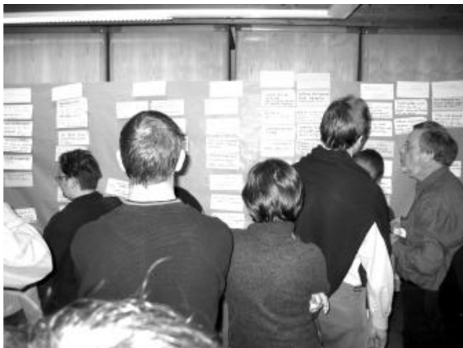
Samenbrengen van meningen, vragen, bedenkingen tot thema's